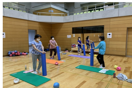
筋膜リリース&ピラティス（土曜日）