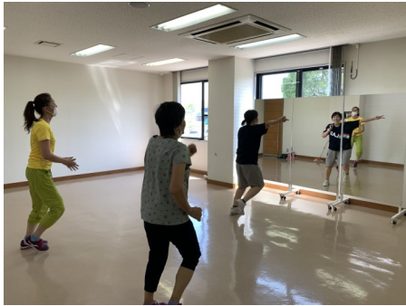
やさしいエアロ（水曜日）