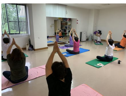
骨盤調整ヨガ（水曜日）