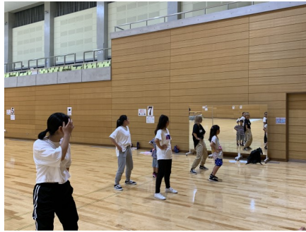
HIPHOPクラス（水曜日）小～高校生まで