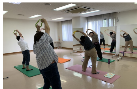
機能改善ストレッチ（木曜日）