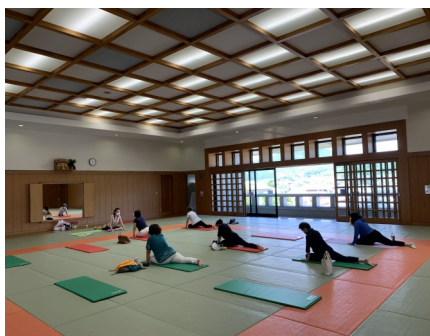
美姿勢・骨盤EXクラス（火曜日）

御船町スポーツセンターのプログラムはどなたでも参加できます。ストレッチから有酸素運動、筋力アップ等、あらゆる年齢層に対応した様々なプログラムを行っています。