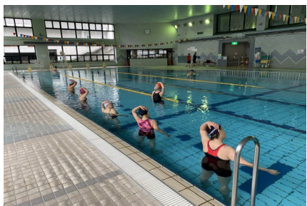
成人水泳教室（金曜日）