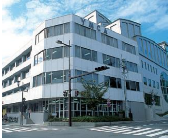
Google Map https://goo.gl/maps/3QpE12319kF2