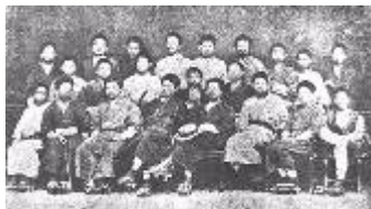
教師ジェーンズから受洗した人々