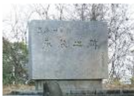
熊本バンド奉教之碑(花岡山)