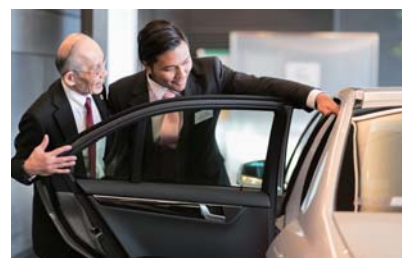
【企業実習(ビジネス総合学科)】