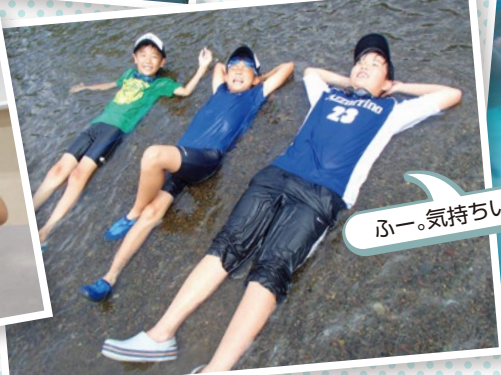
ふー。気持ちいいー