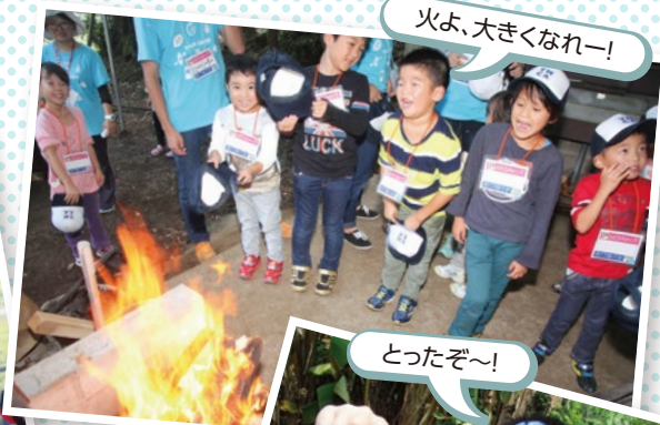
火よ、大きくなれー!