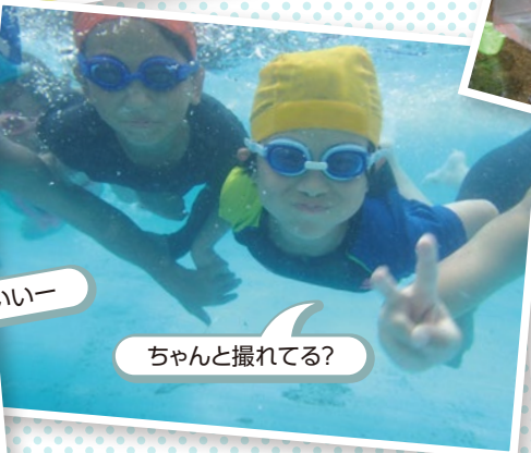
ちゃんと撮れてる?