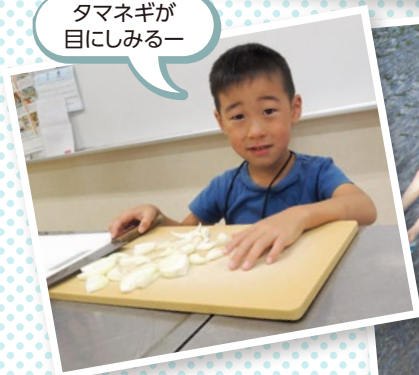
タマネギが目にしみるー