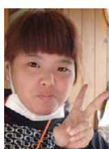
キラゆきグループ キラキラリーダー