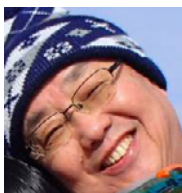
キャンプ長 たぬきリーダー