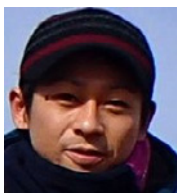
キャンプ担当 ごくうリーダー