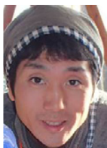
チームレジェンド きりんリーダー