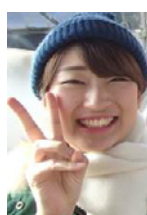
ゆきうさぎグループ トナカイリーダー