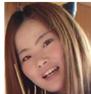
全体サポート さかなリーダー