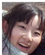
全体サポート くじらリーダー