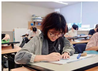
製図の授業に取り組むズーさん