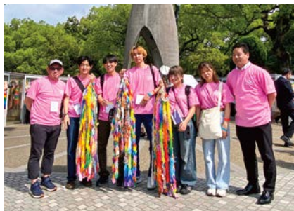
2025年度国際ナショナル・ユースピースセミナーの様子