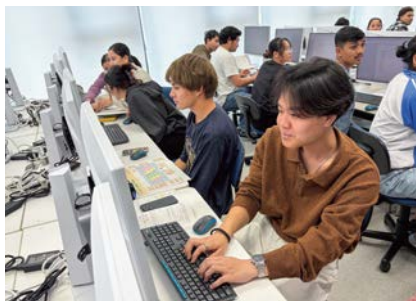
国際ビジネス科の授業の様子