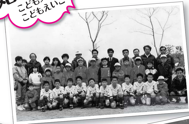
←手前左から5番目 たぬきリーダー(当時12歳)