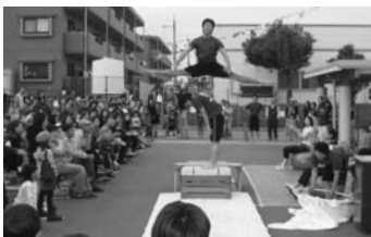
むさしYMCAチャリティバザー

10月18日(日)上通YMCA祭、10月25日(日)むさしYMCAチャリティバザー、11月1日(日)中央YMCA・YMCA学院の前進祭、11月15日(日)東部祭(東部YMCA)と、恒例のYMCA祭りが各地で開催され、多くの来場者でにぎわいました。