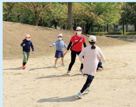
リフレッシュデイキャンプ

公園で遊んだり、ウォークラリーをするなど、野外での活動を中心とし、グループワークの手法を用いて、子どもたち一人ひとりの安心と安全を守りました。保護者からは、「子どもが本当にリフレッシュできたようでした」「家に引きこもって運動不足でしたが、久しぶりに思いっきり遊ぶことができ楽しそうでした」などの感想が寄せられました。