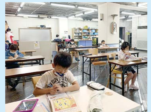
学童保育ユナイト

また、3月から行ってきた子どもの居場所プログラムに続き、4月27日(月)からは「学童保育ユナイト」を展開。対象は医療従事者やひとり親家庭、共働き家庭で、小学生の子どもたちの学習サポートやレクリエーションを行いました。毎週火曜日に中央センターで行ったボランティア講師による硬筆教室では、先生に“はなまる”をもらった子どもたちがとてもうれしそうな様子。YMCA学院の学生もボランティアとして活躍するなど、様々な人たちの協力を得ながら運営を行いました。