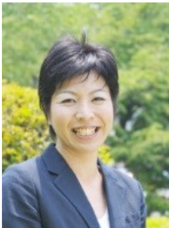
キンギョリーダー