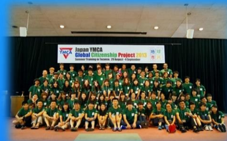
世界の大学生と1週間英語オンリーで リーダーシップトレーニング 「YMCA地球市民育成プロジェクト」