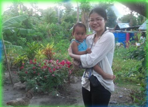
フィリピン台風災害支援