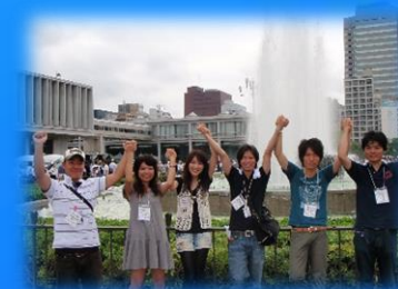
広島YMCA国際青少年 ピースセミナー