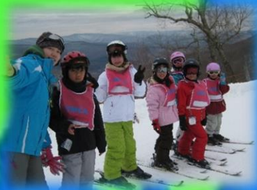
ニューヨーク州 YMCA キャンプリーダー