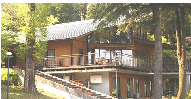
ロッジ、炊さん場、ピザ窯、ファイヤー場など完備

参加費 ・おとな(中学生以上) 3,000円 ・子ども(小学生) 1,500円 ・子ども(幼児) 1,000円 交通費、昼食費、プログラム費、 保険料を含む