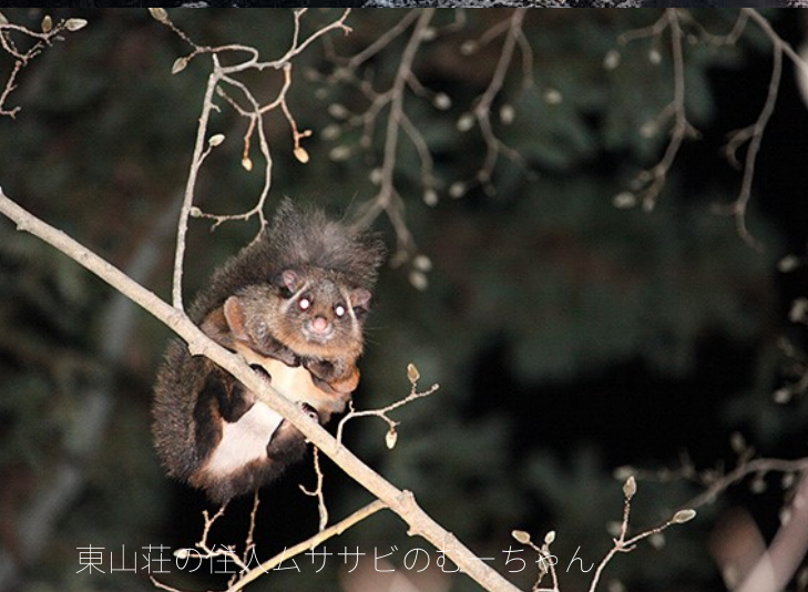
東山荘の住人ササビのむーちゃん

日本一の標高と容姿を誇る「富士山」は、熊本から遙か遠く、その目で見たことがない方も多いと思います。時折、夏の登山シーズンに山頂を目指す様子がテレビで報道されますが、富士山の自然の奥深さは山頂だけではありません。裾野には多様な生き物が住む美しい森林が広がり、湧水、巨樹、300を超える溶岩洞窟群等、四季折々に訪れる人を楽しませてくれます。今回はこの富士山を知り尽くしたYMCA東山荘ネイチャープログラムの経験豊富なスタッフ陣が自然散策「ふじさんぽ」と未開の洞窟探検の旅に皆様をご案内いたします。ご夫婦で、ご家族で、こどもだけでも参加可能です。この春、Youtubeやテレビ、スマートフォン越しでは絶対にできない「本物の体験」をしませんか。