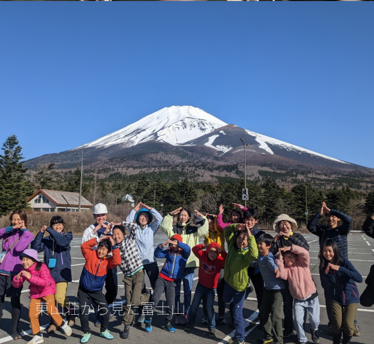
東山荘から見た富士山